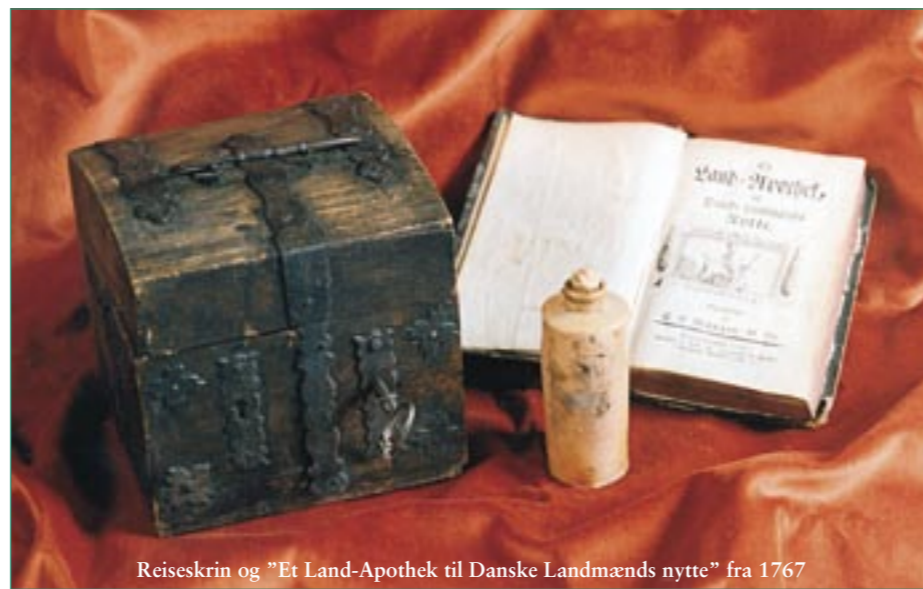
Reiseskrin og "Et Land-Apothek til Danske Landmænds nytte" fra 1767