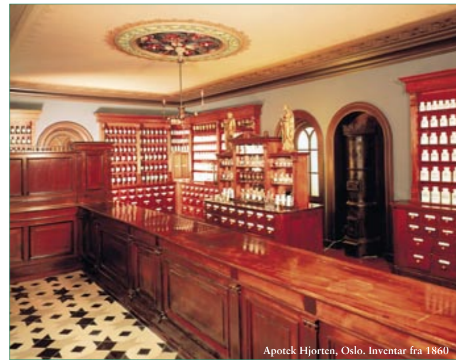
Apotek Hjorten, Oslo. Inventar fra 1860